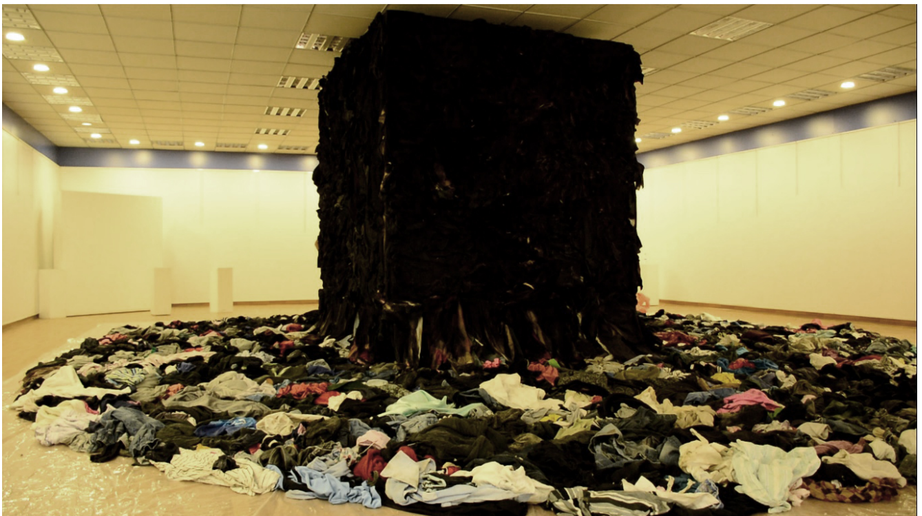
Monika Wagner: Das Material der Kunst. 12

جلوبه رگ یه کێکه له و مه تر یالانه ی که هه ندی هونەرماندانی پاش دووهمین جهنگی جیهانی له کاره کانیاندا زیاتر وه کوو ئاماژه بۆ جهسته له بابته ی یاد ره رری و به بیر هینانه وه به کاریانه پناوه که هه مان مه به سستی عه لی گه رمیانییه له م کارهیدا، له و رووه وه زانای هونهری ئە ئمانی مۆنیکا فاگنهر باس له مانا کانی جلوبه رگ له کاری هونهری هاوچه رخ ده کا وه کوو شاهید بۆ جهسته، وه کوو جی پێی جهسته، وه کوو په نجه مۆری جهسته و ده لی: جلوبه رگ شاهید و جی پێ و په نجه مۆریکێ ره سه نه بۆ جهسته و ده توانن زۆر باش گوزارشت له جهسته بکه ن، له به ر ئە وهی ئە مه جهسته یه که جلوبه رگ له به رده کات. 12 به واتایه کی دی ئە مه جلوبه رگه که له ش دائه پۆشی. فاگنهر باس له جلوبه رگ له میانی کاره کانی هه ر دوو هونەرماندی ئیتالی می شیله نجه لو پستۆ لیتۆی Michelangelo Pistoletto و فه ره نسـی. کرس تیان بۆ لته نسکی Christian Boltanski ده کات که له کۆن تیکستی جیا جیادا له