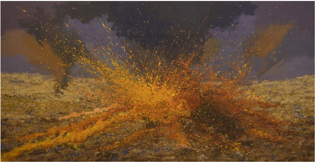
سوڤیان جه لال، کەر مەستەهی تیکەمەل لەسەر قوماش، ۲۰۱۸X۳۸۰سم، ۲۰۱۸.