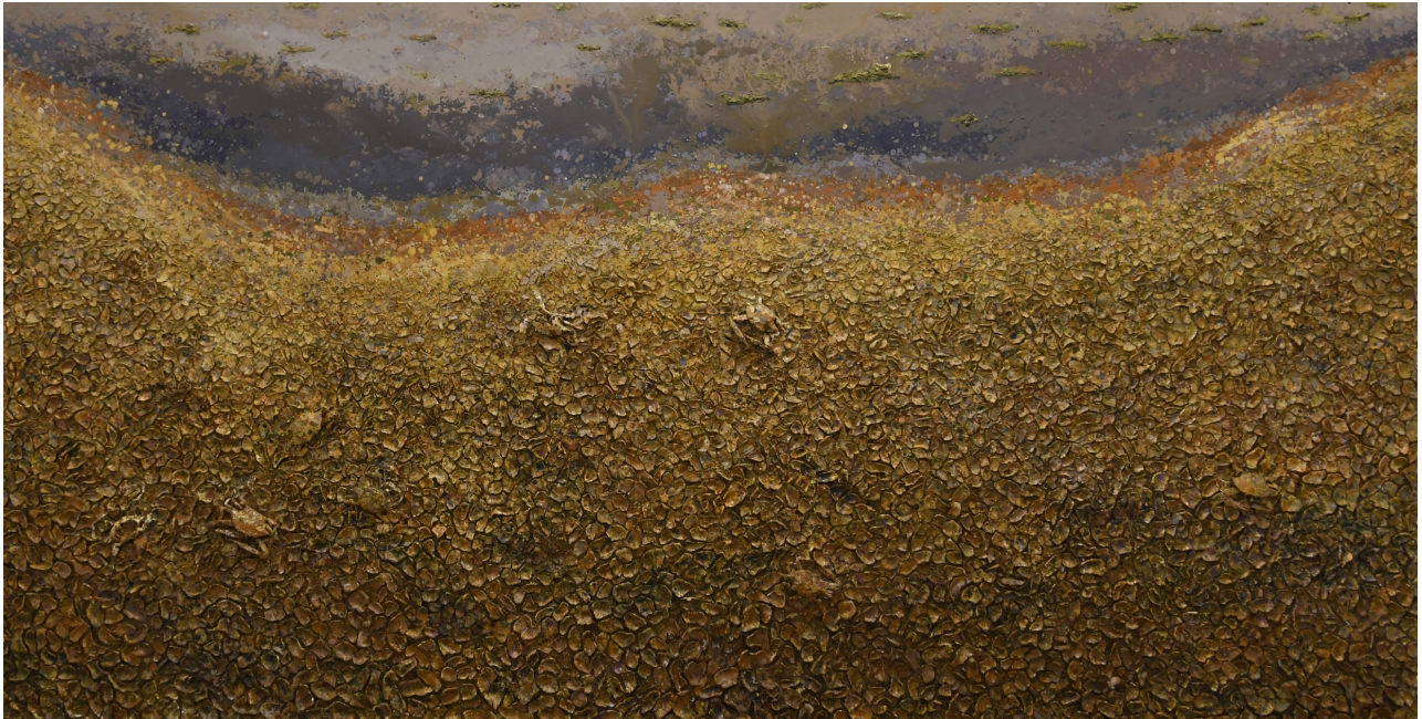
سوفیان جه‌لال، کهرسته‌ی تیکه‌ل له‌سه‌ر قوماش، ۲۰۱۸، ۲۰۰X۳۸۰سم

تابلۆیانه‌ی به‌ر هه‌مه‌هاتوون ڕه‌نگدانه‌وه‌ی خوددیدی هونهرمه‌ندان و سیاق و سه‌رده‌مه‌که‌ی خۆیانی پێوه دیار بووه.