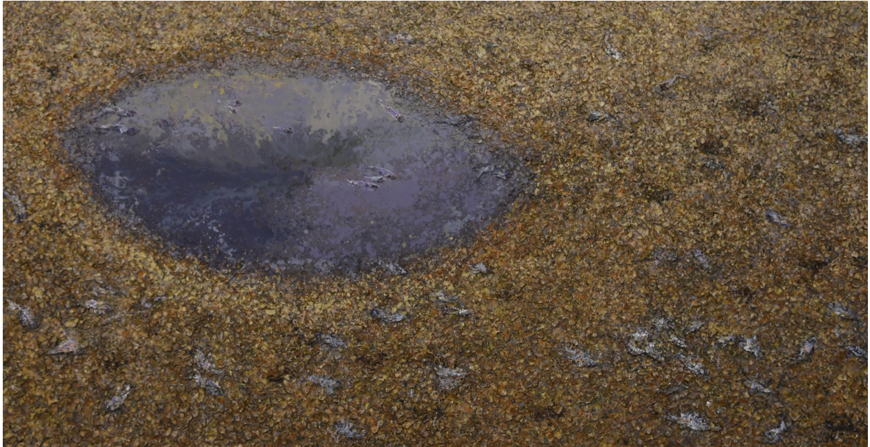
سوفیان جەلال، کەرستەیی تیکەل لەسەر قوماش، ۲۰۱۸، ۲۰X۳۸سم، ۲۰۱۸.

ئەو هەستەیی لەلا دروست دەبێت. بەلام هونەرمەند بۆ ئەوەی لەبەر امبەر بەم رووداوانە ئەو هەستەمان لەلا دروست نەبێت و سەرچاوەی ئەم رووداوانە نەگەر ینینەو بەو هێزێکی مۆتەعالی، رووبەری ئاسمانی تارا دەیهێکی زۆر فەرماۆشکردووە. کەواتە گەر هێزێکی میتافیزیکی لەپشتەوێ ئەم رووداوانەو نەبێت، ئەو مەزۆف بکەری پشتهوێ ئەم رووداو و کارساتانەییە و خۆی هۆکاری تێکدانی سرووشتە.