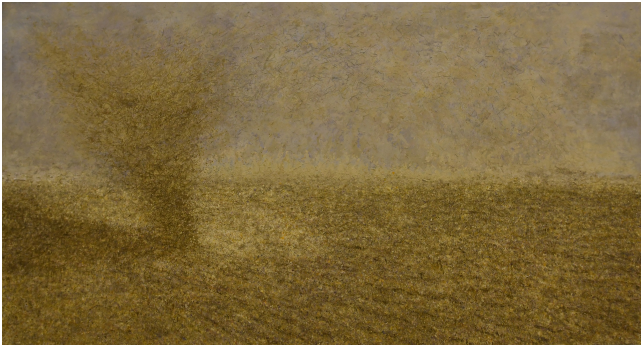
سوفیان جه لال، کهرستهی تیکهمل لسهسر قوماش، ۲۰۱۸، ۲۰۰X۳۸۰سم، فوتۆ: ههیمن کاکهیی