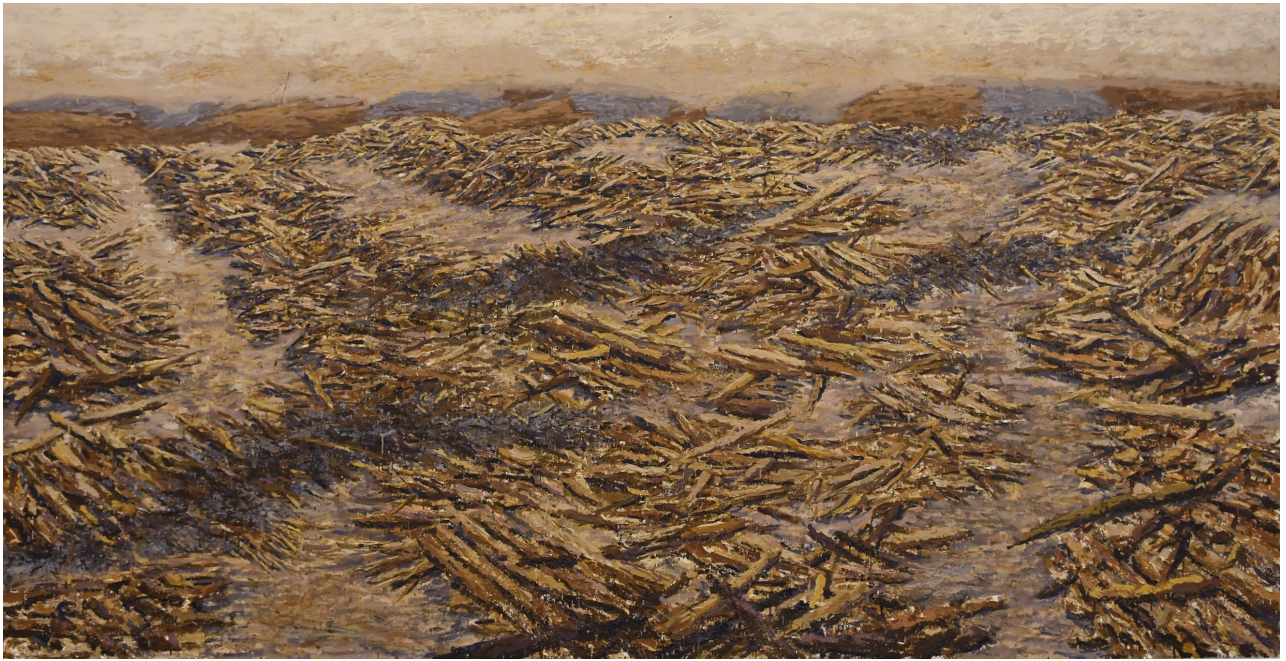
سوفیان جه لال، کهرستهی تیکهمل لسهسر قوماش، ۲۰۱۸، ۲۰۰X۳۸۰سم، فوتۆ: ههیمن کاکهیی