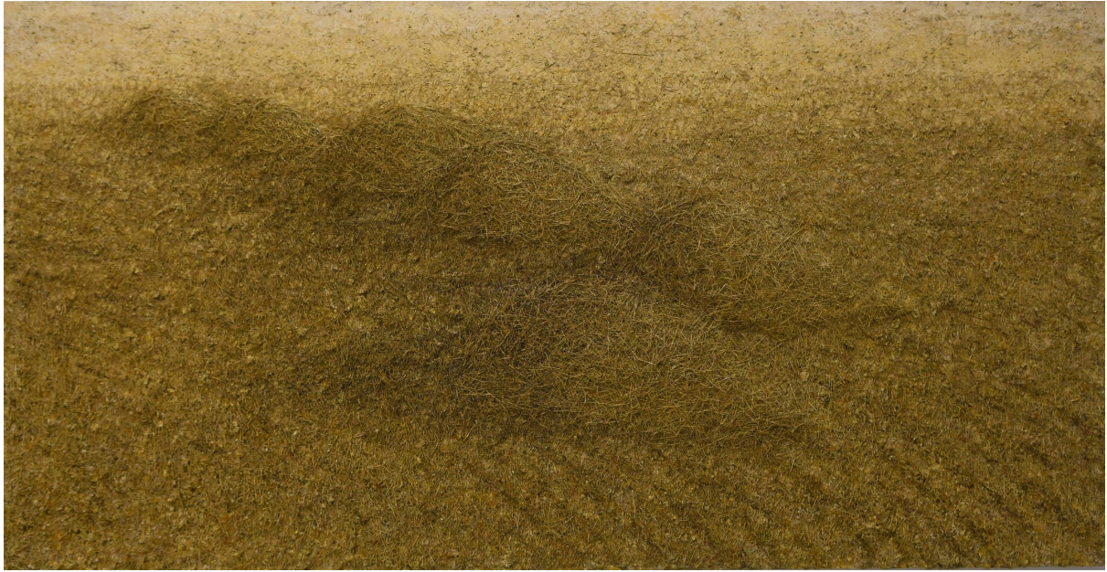
سوفيان جه لال، كهه سه تهى تىكهه ل سههه قوماش، ٣٨٠X٢٠٠سم، ٢٠١٨.