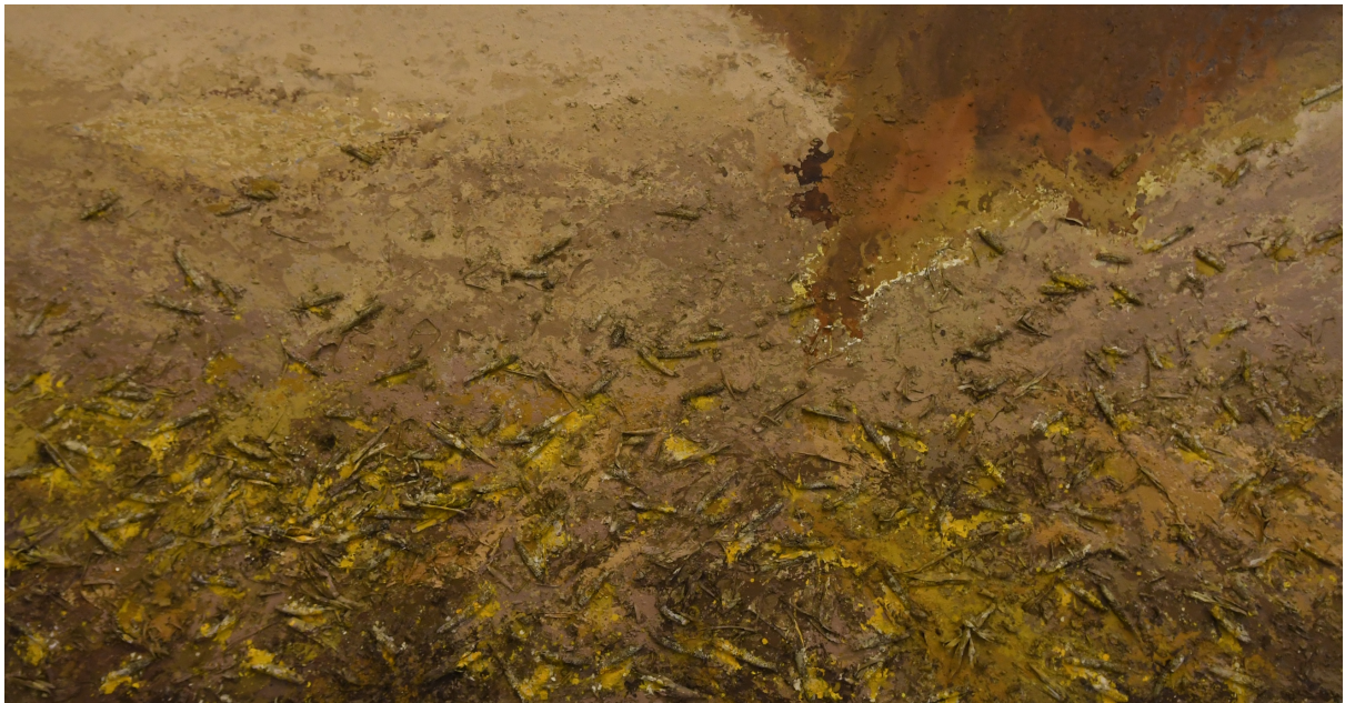
سوفيان جه لال، كهه سه تهى تىكهه ل سهههه قوماش، ٣٨٠X٢٠٠سم، ٢٠١٨.