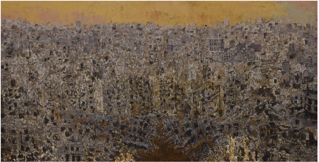
سوفیان جه لال، کهرستهی تیکههه له سههر قوماش، ۳۸۰X۲۰۰سم، ۲۰۱۸.