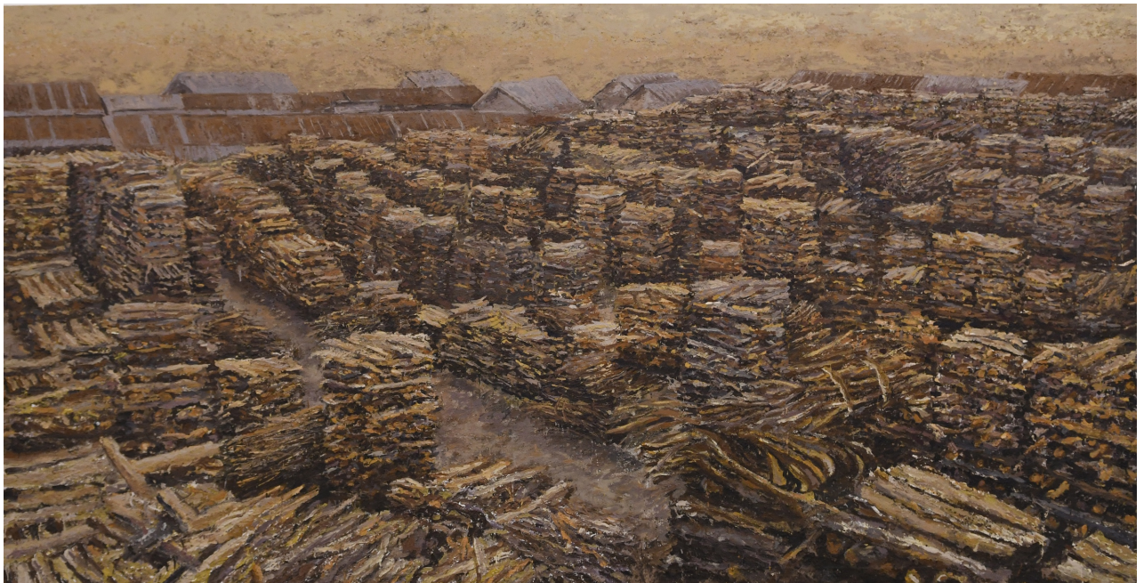
سوفیان جه لال، کهرستهی تیکههه له سههر قوماش، ۳۸۰X۲۰۰سم، ۲۰۱۸.