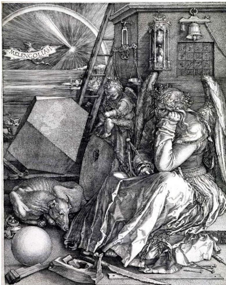
مالیخولیا، بەرھەمێکی ھەنگولراوی ساڵی ۱۵۱۴ ھونەر مەندی ئەلمانی (ئەطیر نیشەت دورەر)ە.

و میژوونووسانی ھونەر ناماژەیان بە بەرھەمە ھونەرییە ئەلیگۆرییەکی دیناکروا بە ناوی ئازادیی لە سەنگەرەکاندا (1830) کردوو. دواى ئەمە، مۆدیل و شیوازی ئەلیگۆریی تەنھا دەبێتە شتیکی ئەکادیمی و بێزارکەر، و لەلایەن ئەکادیمیە خاوەن نێمتیازەکانەو تەنھا وەک پرۆژەیهکی سەر بە میژووی کولتووری، لیکۆلینەوێ لەسەر دەکرێت. و ھەولێ بنیامین بۆ لیکدانەوێ مالیخولیا و ئەلیگۆریی، ھەولێک بوو بە ناراستەى ڕزگارکردنی لە چنگی ئەکادیمیەکان، بە کورتی: ھەولێک بوو بۆ نووسینەوێ میژووی ھونەر نەک وەک ئۆبژێکت و بابەتیکی میژوویی سەر بەرابردوو، بەلکو ھینانی بۆ نێستا و، دواچار نووسینەوێ میژووی ھونەر لە روانگەى چەوساوانەو. تیزی ئاویتەکردنی ئەلیگۆری و مالیخولیا ئەم دەرفەتەى بە بنیامین بەخشیبوو. خۆ ئەگەرچی بودلیر دەکرا ھەردوو مۆدیلەکە دەک بەکریت و نیشان بەدریت.