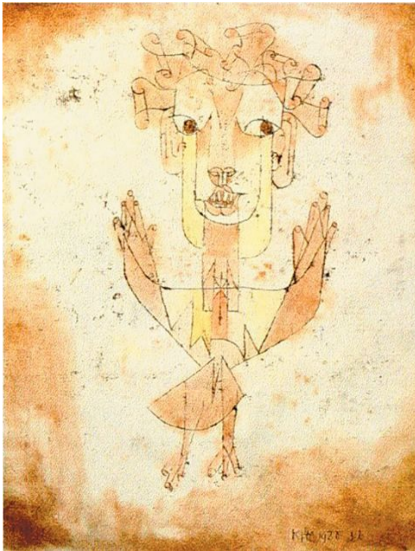
تابلۆی (فریشتهی نوێ)ی بهرهممی هونهرمهند (پاول كلێ) 1920

وهك ئەمڕۆ ئەكادیمیا ئەم پێگهیهی به بنیامین بهخشیوه كه خۆی ههم نهیویستوووه و ههم هەرگیزیش پێینهگهیشتوووه. مێژوو له ئەكادیمیا دا دهبیته مێژووگهراپی (historicism)، واتا هاوسۆزبیکردن لهگهڵ چینه بالادهستهكان، له شهقامیشدا دهبیته مێژوو له سهنگههكاندا، واتا خهباتی چینهیهتی و جهنگی پارتیزانی. ئایا ناوێشانی بودلیر و شهقامهکانی پاریس چ شتێك ناشکرا دهکات؟