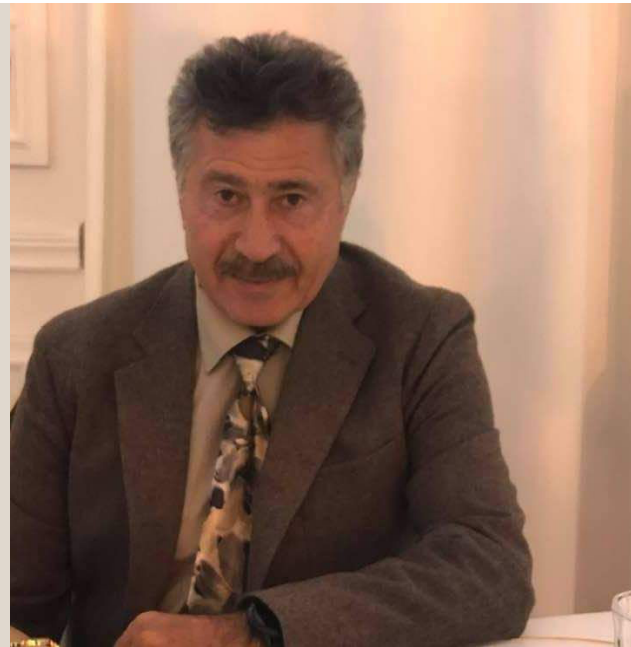
3ی تشرینی بهکهم 2021 وتار، شیوهزاری ههورامی

پۆمانه و "چناره" ی، نویسته و "پهزا بههمهنی" نه. نویسه نیشته جاو وه لاتوو سوئیدین و به تازهیی "چناره" ش چاپ کهردهن. ئی کتیبه دووهم پۆمانه و نویسه رینه. بههمهنی نزیک به دوئ سالا چپوهلی پۆمانپوهش به نامپو "سیاورپیحانه" ی چاپه کهرده و ههرپاسه، ئهدهبیاتی داستانی به برپو کوله داستانی ش جه سووشیال میدیانه وهلا کهر دینپوه. ئی وتاره به گردی گهرهکش جا جه دوئ بهشینه ئهوه وانای ئی به رههمی کهرۆ. به شوو یه کهمینه