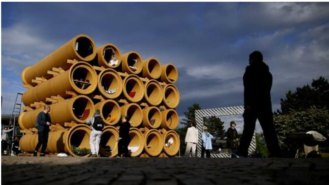
When We were Exhaling کاری هونه‌رمه‌ندی کورد هیوا ک.