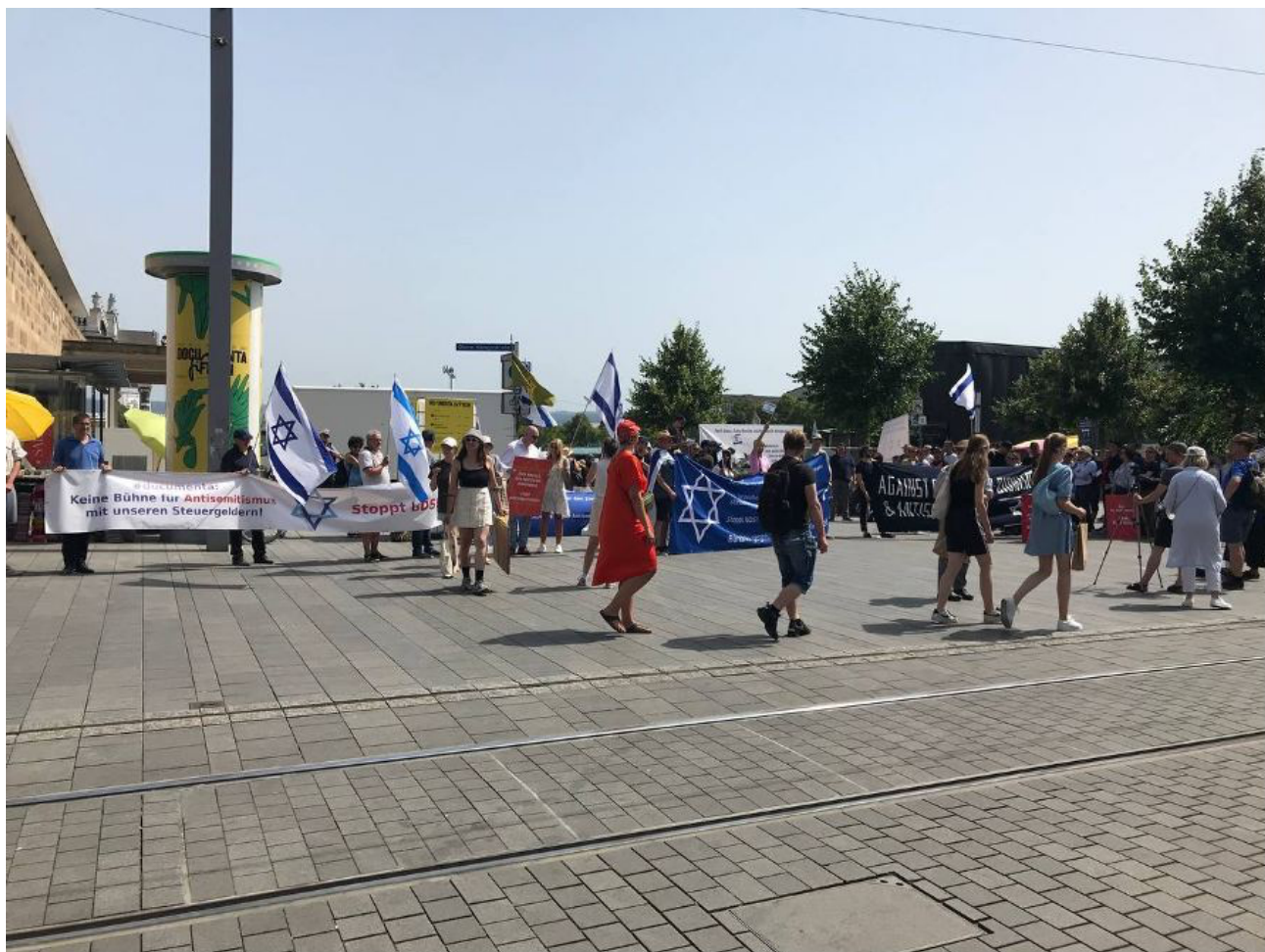
خۆپیشاندانی زایونیسته کان دژ به دیکومینتا و روان-گروپ. 2022. 18.06

که پتر له م هیله راسیستییه نزیک دهنه وه زایونیسته کانن؛ جووه دهمارگیره کان بو دهولته ئیسرائیل که هر رهخنه یه ک له دهوله ته که وهک دژایه تیی سامی لیک دهدنه وه. ئەم نارەزایه تییی وای ئیستا به رامبه ر دیکومینتا هه یه ریک گوتاریک هه لگریه تی که "دهوله ت" و "گه ل" ی ئیسرائیل هاوشوناس و ته با ده بینیت، واته نه ک خوی هیچ کاریکی دهوله ته که ی سه رکونه ناکات، به لگوو هر سه رکونه یه ک به راسیزم به رامبه ر هه موو گه لی جوو لیک ده داته وه.