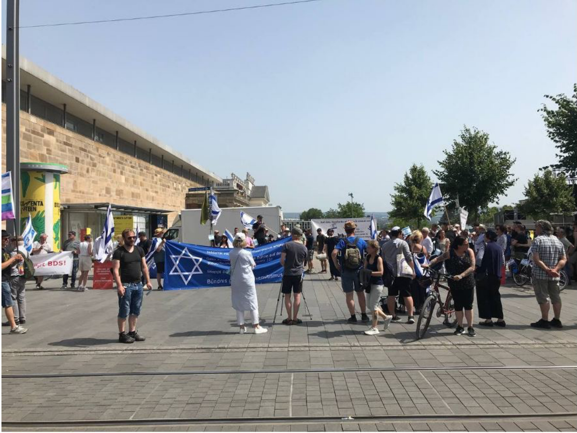
خۆپیشانداڭى زايۇنىستهكان دژ به ديکومينتا و روان-گروپ. 2022. 18.06