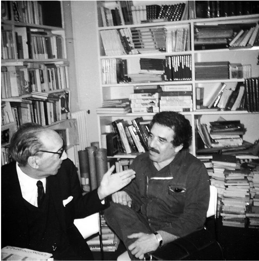
خوان كارلوس ئۇنىتې و گابرييل گارسييا ماركيز، بارسيلونا، ۱۹۸۰.

دواكۆچى ئۇنىتې بىست سالى رەبەقى بەسەردا تىپەريو، شايەتى كەمىش لەسەر ئۇنىتې راستەقىنە بەردەستە و رامون چاۋ كۆى كىردوونەتەو. دەرھىنەرى ئىسپانى، خوسى ماریا بىرزوسا، بە مەبەستى توماركردى دىمانەيەك لەگەل ئەم نووسەرە ئوروگوايى، دوو جار لە پاریسەو چووەتە مەدرىد، كەچى ھەر مىواندارىشى لى نەكردووە. داۋاى لە چاۋ كىردووە بىتە تىككارى، ئەویش تەلەفونى بۇ ئۇنىتې كىردووە. «ھەمىشە دۆلى زنى وەلامى دەدايەو، كەچى ئەو جارەيان خۆى ھەلىگرت. من: "بە ئەرك نەبىت، دەمەوئىت لەگەل بەرپىز ئۇنىتې قسە بكەم.", "ھا؟ بەرپىز كى؟ ئىرە ھىچ بەرپىزىكى لى نىيە! ھەر ئۇنىتې يەكى لىيە، ئەویش خۆم! چىت دەوئىت؟". لىزمەباران دەخوساندم. گەرچى دەلوا زىانى لەو ھاۋرپىيە تىيە مەزەمانى بدات، پىرتاۋ چاۋبەستىكم گەلالە كىرد: "بۇ تەلەفونى فەرەنسىيە: دەمانەوئىت ناۋ و ناۋبانگت بگەيەننە ئاستى