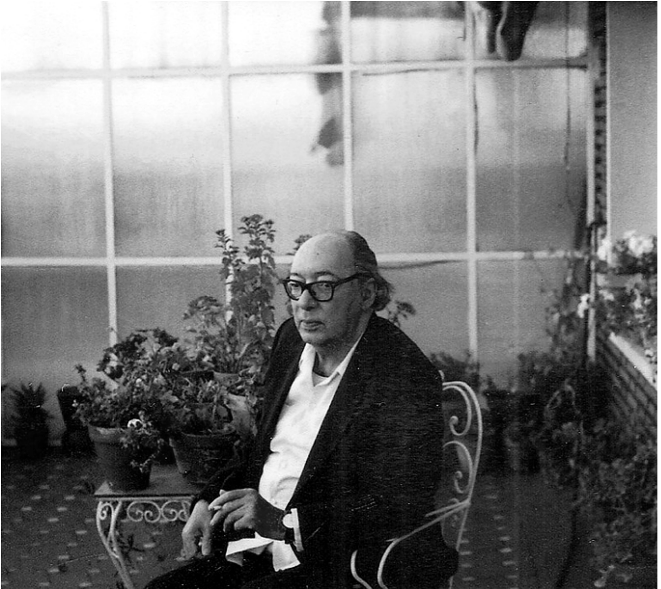
خوان كارلوس ئۇنىتې، مەدرىد، ۱۹۸۵.