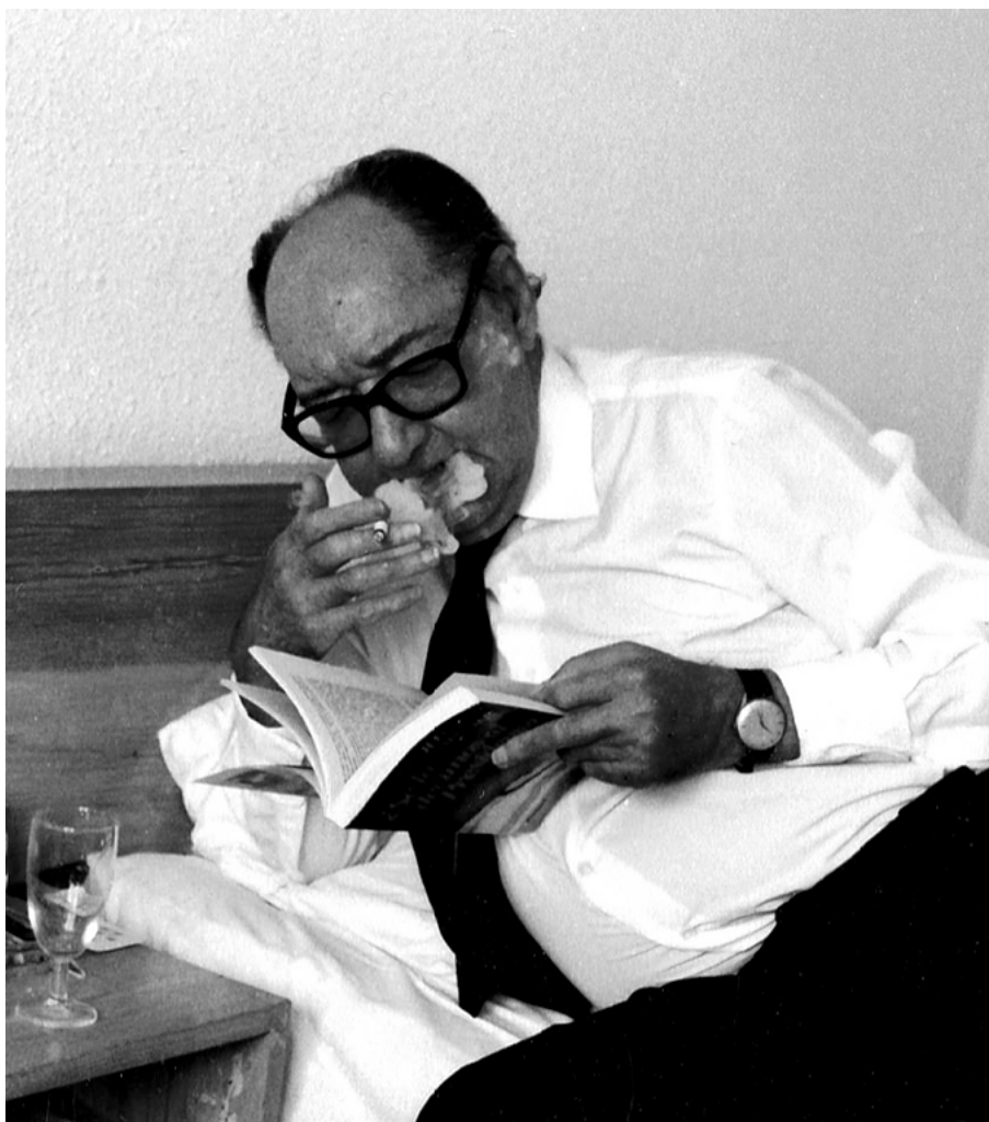
خوان كارلوس ئونىتى. چركاندن: دۆلى ئونىتى / كاسا دى ئەمريكا

بەبى بچوكتىن پلان و بەرنامە ژياو، گالتەى لە خوڭشويستنى كاترميريش هاتوو. قەت مى لە ويژه نەناو. خوڭى رادەست كردوو. تاكە ويستى لە ويژه دا، بەوپەرى هيوابراو، چنگخستنى ئارامى بوو. دۆلى دواى بيست سال لە مردنى ئونىتى دەگيرىتەو: «خاوخاو بە دەست دەينووسى؛ ئەمەيش دەرفەتى بىرکردنەو پى دەدا و رپى پىداچوونەو لى دەگرت. هەر دەينووسى و سەرچاو». قەت نەگەراو تەو سەر نووسىنەكانى. جاريكيان رۆژنامەنووسىك لە ئونىتى پرسىو: «بۆچوونت چىيە كاتىك ئونىتى دەخوينىتەو؟» ئەوئىش وەلامى داو تەو: «من قەت ئونىتى ناخوينمەو». گەر لىت پىرسىايە ئاخىر ئەو چۆن رپى تى دەچىت و كارى كردن نىيە، دەستبەجى بىرى دەخستىتەو: «سەگ ناگەرىتەو سەر رشانەو كەى». بۆچوونەكەى ئونىتى پىچەوانەى ئىرنست هەمىنگوئى بوو: «يەكەم رەشنووس هەمىشە گەنوگوو».