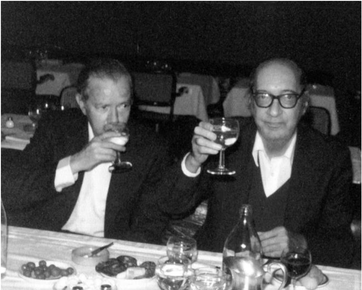
خوان كارلوس ئونىتى و خوان رولفو، ۱۹۷۹، چركاندن: دۆلى ئونىتى

سالى ۱۹۸۱، وەك براوۋى خەلاتى سىرۋانتىس، ئونىتى ھېچ چارەيەكى ترى نەبوۋە و دەبوۋايە بۇ ۋەرگرتنى خەلاتەكە لە مال بچىتە دەرەۋە. رۆژى پىشتىر، لاي رۆژنامەنوس ئولگا ئالفاريز لە رۆژنامەى ئىل پاپس دركاندوۋىيەتى: «دەزانی حەز دەكەم بەيانى پىنجشەممە چى بکەم، گيانە؟ خۆم تىكەلى ئەو ئاپۇرايە بکەم، خۆم بشارمەۋە و كەس نەمدۆزىتەۋە.» دۆلى دەگىرپىتەۋە، پاش بۆنەكەى زانكۆى ئەلكالا دى ھىرنارىس «ئونىتى بە شاژنى گوت ماندووم و دواى بۆنەكە نامىنمەۋە.» بە ھۆى جگەرەۋە، چەند خولەكىك خۆى لەۋى گل داۋەتەۋە. ھەر يەكەمىن جگەرەى بە لالیۋىيەۋە ناۋە، دەستى بە گىرفانى چاكەتەكەيدا گىراۋە و چەرخەكەى نەدۆزىۋەتەۋە. پاشاى ولات لە تەنىشت ئونىتىيەۋە راۋەستاۋە، ئەمىش لى پىسيۋە: «ئەرى چەرخت پىيە؟» جەنابى پاشايش ۋەلامى داۋەتەۋە: «نە.» ئىدى ئونىتى لاترىسكەى لى بەستوۋە و ھەلتەك-ھەلتەك چوۋە بە دواى چەرخدا گەراۋە.