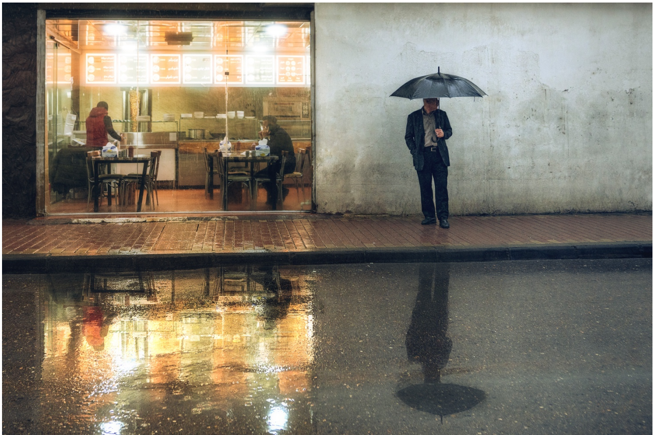
یه‌کیک له چیش‌خانه‌کانی سلیمانی.