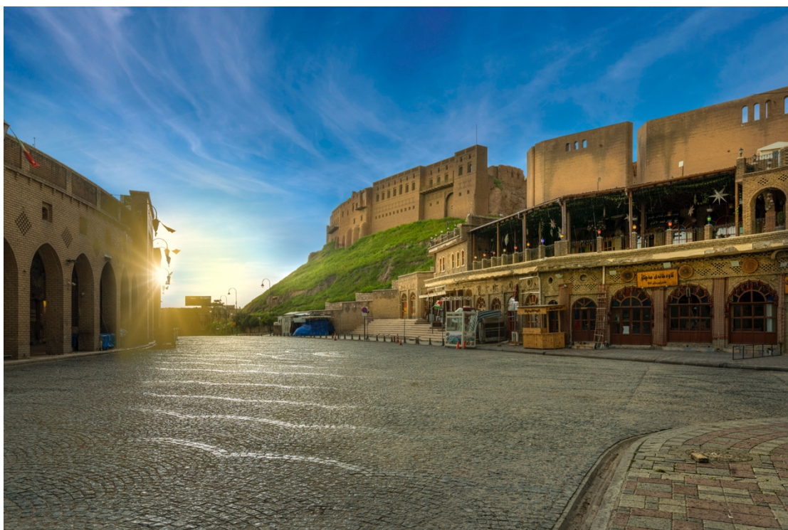
یهکیک له شهقامهکانی شاری همولیر لهکاتی کهرهنتینه