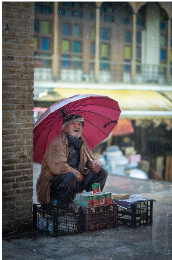
فروشيارىك خهريكى كهسابهته لهناو بازارى سليمانى.

بويه لهم حالهتانه ناحهز بهديار دهكهون. كهسهكان نا، بهلكوو چيروك و پهيامهكه!