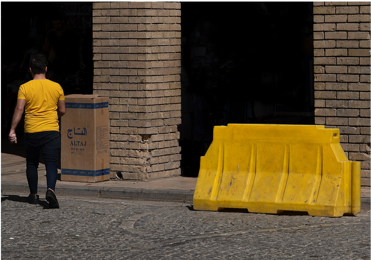
رهنگه لمیهکچوو هکان و لکاندیان بهیهکهوه له فریمیکدا.