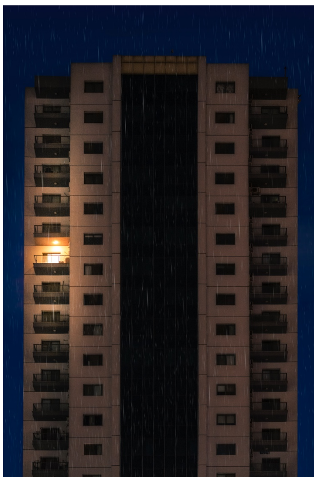
یهکیک له بالهخانهکانی شاری همولیر له شهویکی باراناویددا.