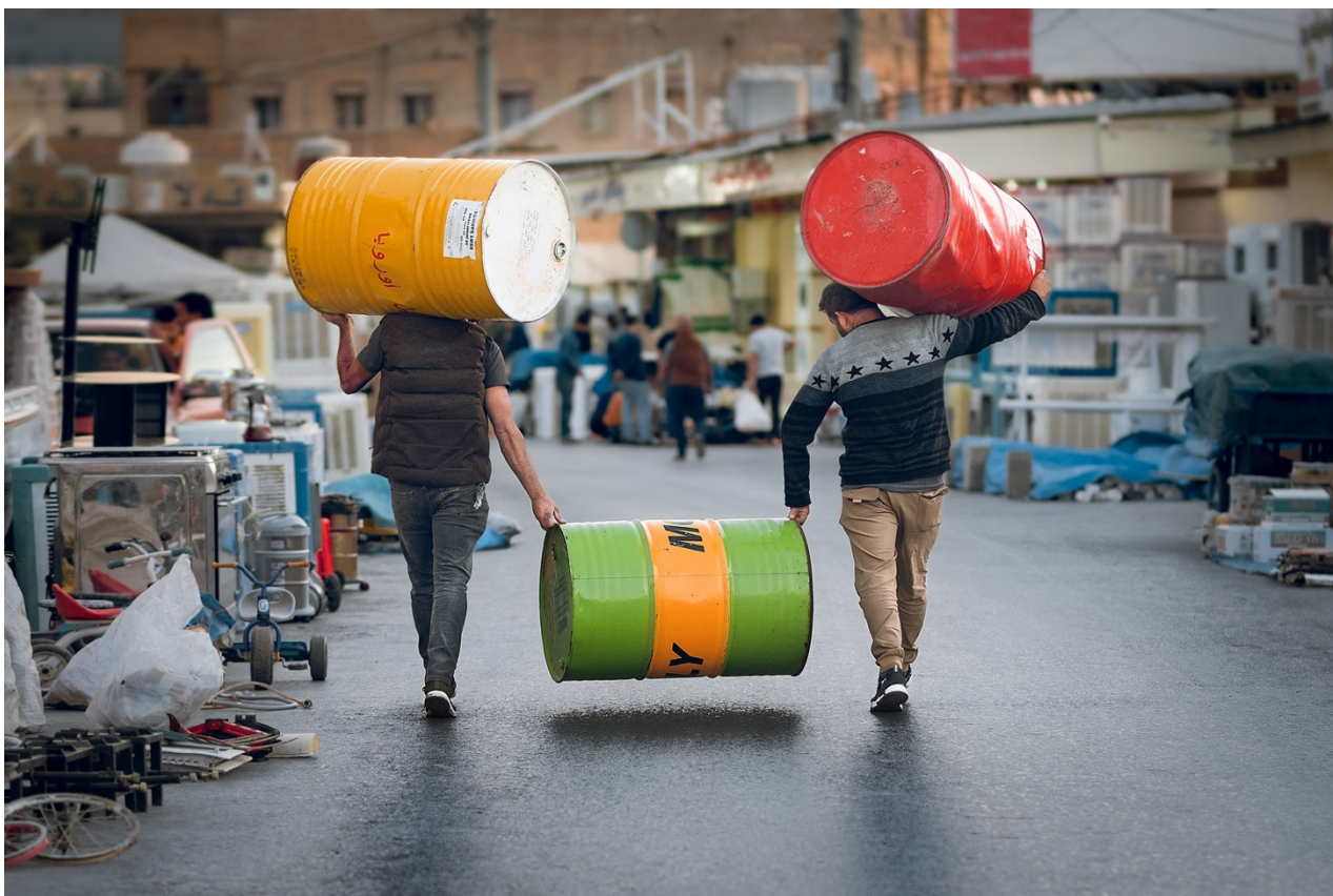
کارکردن له سه شتی په راویزخراو.

جیاوازر له وانهش؛ ئیشکرده له سه شته په راویزخراوهکان. وهک "سییه، حالته پارادوکسییهکان، پانتایی، نیگه تیغ سپهیس، ههروهه رهنگه لیکچوو و دژهکان".