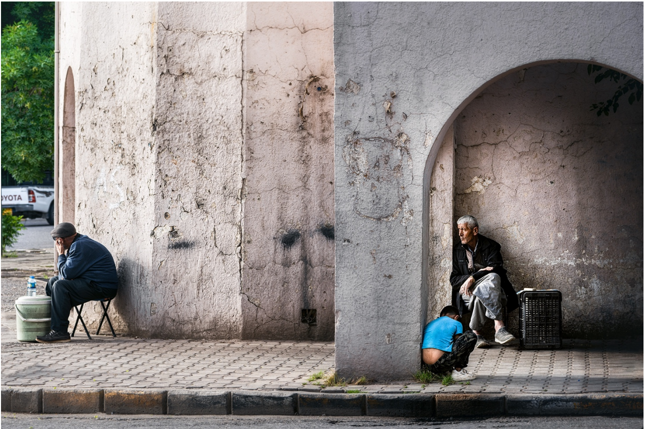
یاسای ژمارەیی تاک (rule of odd numbers) بە یەکیک لە یاسا گرنگەگان دادەنری لە فۆتوگرافیدا. (سلیمانی).

یەکەم: گوشە، کە بە خالیکی گرنگی ئەو ستایلە دادەنری، بۆیە پیویستە فۆتوگرافەری شەقام زۆرتەری زانیاری لەسەر یاساکانی گوشە هەبێ و بیانکاتە پراکتیک.