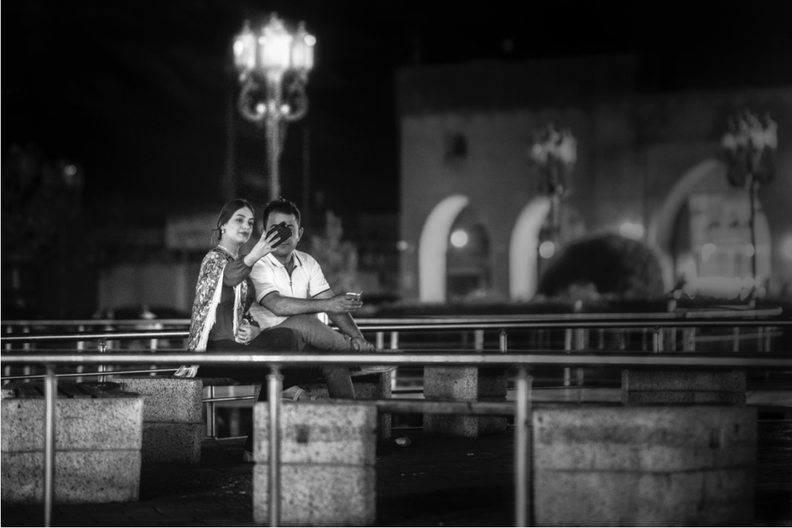
چىژوەرگرتنى ژن و پىاوىك لە چۆلى و بىدەنگى شەوىكى بازارى شارى هەولئەر.

شەقامەكان تژىن لە ڤوودا و بابەت، لى كەسىكى دەوئەت كۆيان بكاتەو. فۆتوگرافەر گونجاوترىن كەسە كە بتوانئەت ئەركى ئەو كۆكردنەو دەيە لە ئەستۆ بگرئەت و لە فرىمىكى هونەرى نىشانى بەت. گومانىش لەو دەا نىيە گرتنى هەر وئەيەكى شەقام، خزمەتكدنە بە خەلك و هونەرى ئەو شارە. بۆيە شارەزايانى بواری فۆتوگرافى دەلئەن: بەو پىنەي شەقام مولكى گشتىيە، شەقام و ئەو دەشى تىدایە، دەبى بۆ فۆتوگرافەر مولكى گشتى بىت و حەلال بۆ ئەو ببىنرئەت.