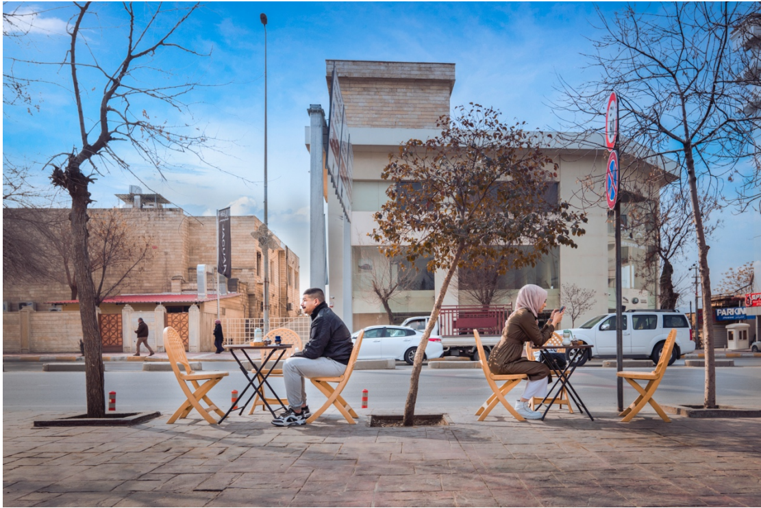
قاومخانه‌یه‌کی سمر شه‌قام له سلیمانی.