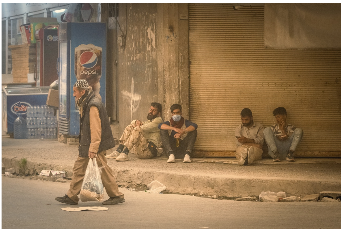
له روژيكي خوآبارين، همنديك كاسبكار، خريكي پشون.

گيرانه وهى چيروكى كه سهكان به وينه، جياوازه له گهال گيرانه وهيان به نووسين. هيچ كاتيك نووسين وينه كتومتى شتهكان ناتوانى نيشان بدات، بهلكوو هيلى ئه و برىتييه له به دهنگردنى شتهكان. به پيچه وانه وه وينه؛ برىتييه له خودى شتهكان وهك ئه وهى كه هه ن. به لام هيچ كات وينه نابى بگيريت بو ئه وهى ديمه نهكان بگوازيتته وه، ئه وه ده بىته له به رگرتنه وه و گرنگى و به هاكهى له دهست ده دات. ده بى وينه بو ئه وه بگيريت كه ديمه نهكان بگوريت. گورپينيان بو دوخى ديكهى وهك؛ ئىستاتىكا، يان بو شيوازيك له سورىالى و يانيش به فورمىكى زانستى نيشانى بدات.