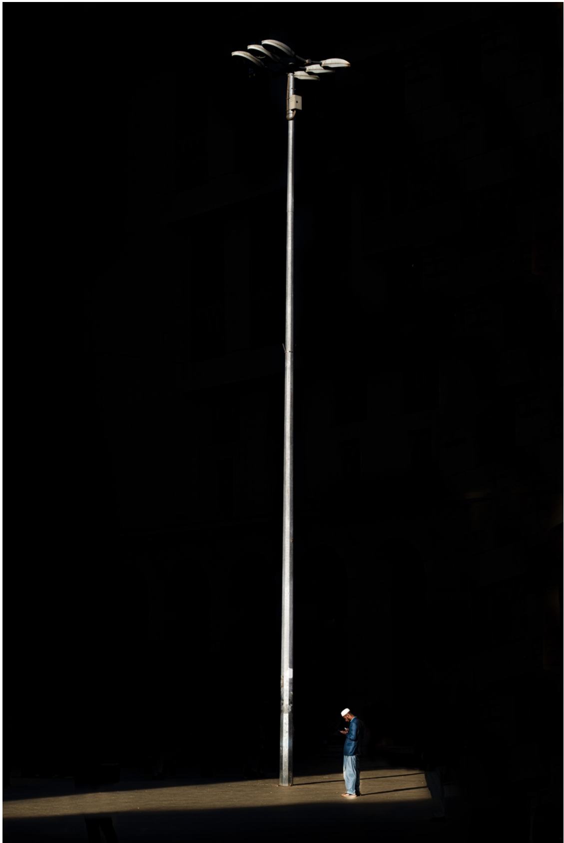
شوینکه، بهکیک له شهقامهکانی شاری بهغدایه.