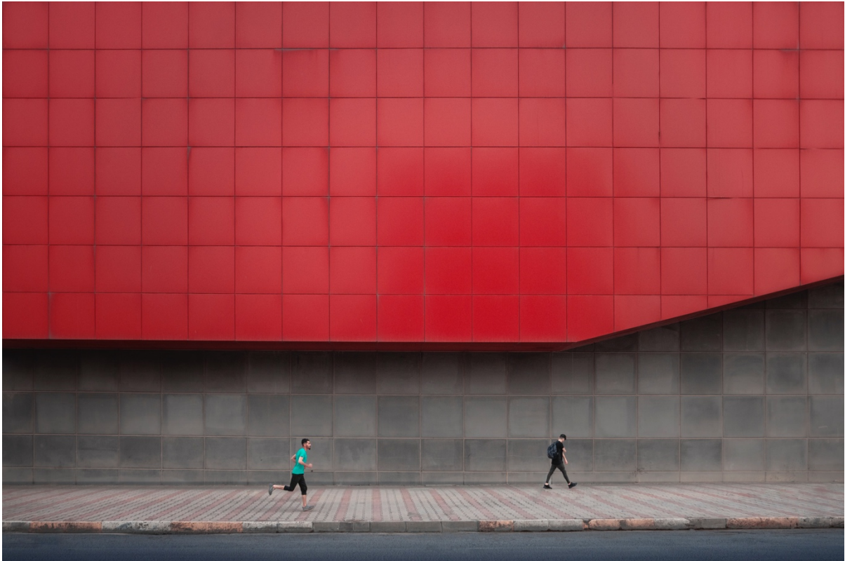
سوود وهرگرتن له پانتایی و بوشایی نهرینی و نیشاندانی گوشهیهکی مینیمال.