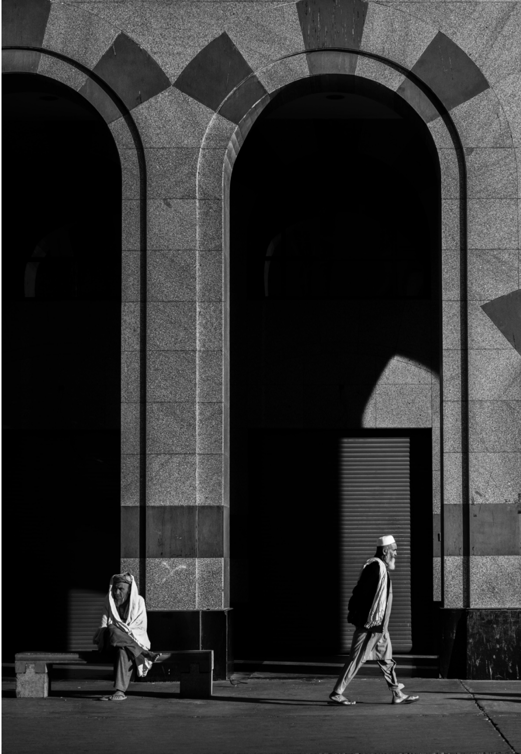
خۇدانە بەر تېشىكى خۆر، يەككەك لە شەقامەكانى شارى مەدىنەى سەئۇدىە.

ھەموو ئەو فۇتۇيانەى پەيامدەرن، يان سەرنجراكىشن و بىنەر لەسەريان دەوەستى، فۇتۇگرافەر لە ھەموو كەس باشتەر دەزانى بە چ شىوازيك دەرۇستيان دىت. بۇيە پىئويستە بزائىن، كە فۇتۇگرافەرى شەقام پىئويست نىيە و ئىشى ئەویش