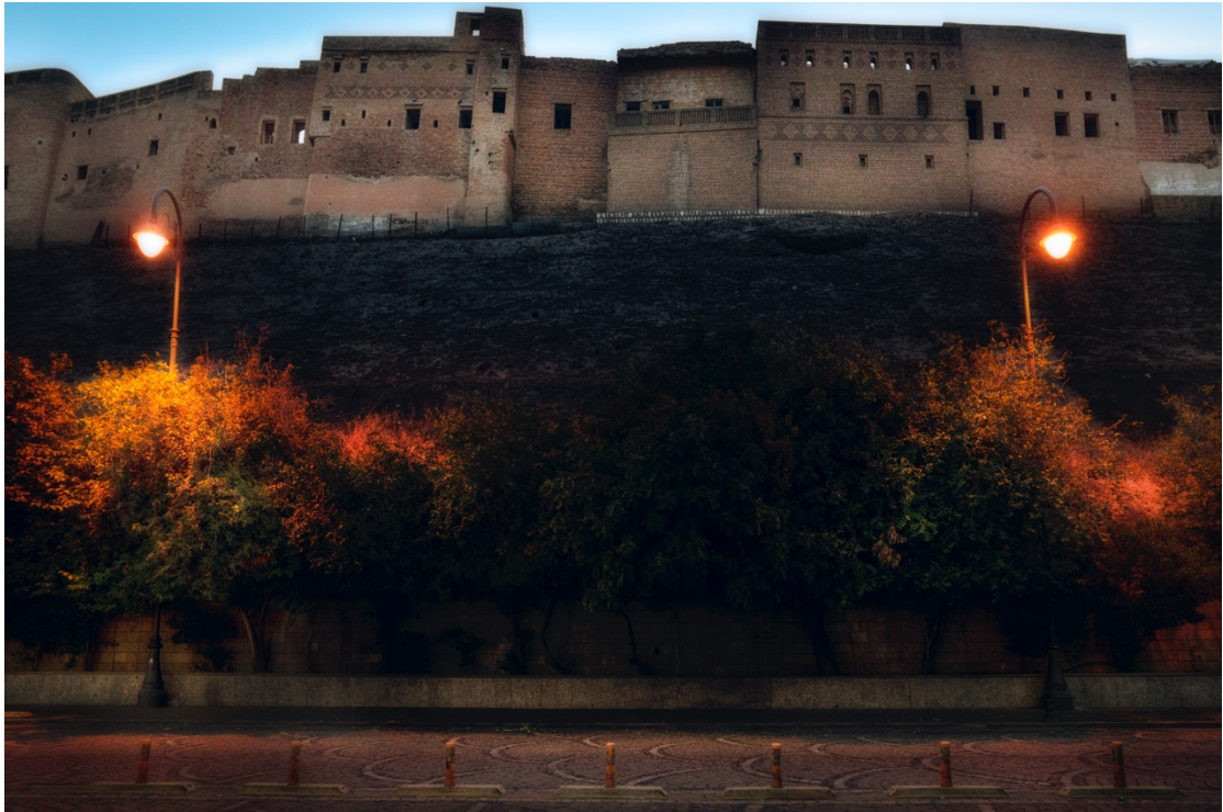
گۆشەبەك لە قەلای ھەولێر لە بەیانییەکی زوودا.

ئەم شینوازی وینە، جیاوازی لەگەڵ وینە ئاساییدا ئەوەیە؛ فۆتوگرافەر چیرۆکیکت بۆ دەگێریتەو. یان حالەتی دەگمەن و نامۆ دەگوازیتەو. ھەلبەت ئەوانە وا دەکەن ببن بە دیمەنیکی سەرنجراکێش بۆ بینەر و فۆتویەکی راگوزەر نەبێ بۆیان. وینە واتا ئەو بوونەکی بە پێی سروشتی خۆی، خۆی نیشان دەدات و دەردەکەوێ. چیهتی وینە، حەتمەن ھەر لەناو دەرکەوتنەکاندا. ئەم قسە یە تەنیا بۆ وینە فیزیکیەکان راست نییە، بە لکوو بۆ ھەموو وینە خەیاڵییەکانیش دروستە. ئەو وینانەکی کە لە ئەندێشە و ھزرمان وینایان دەکەن، لە پرۆسیسیکی خەیاڵئامیزانەدا، دەرخەینە نیو فریمیک لە خەیاڵدانمان و ئەمەیش ئۆتوماتیکی دەبیتە وینە یەکی زھنی.